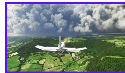
Utilisation de la photogrammétrie et des données BING et OSM pour la création des environnements dans Flight Simulator