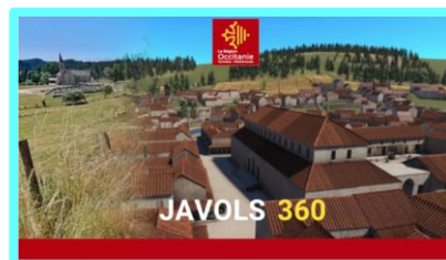
Immersion virtuelle dans la ville antique de Javols