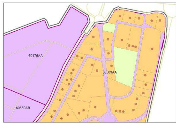
Visualisation de la base de données sur l'activité économique