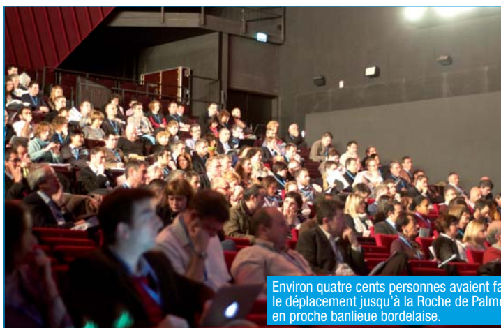
Environ quatre cents personnes avaient fait le déplacement jusqu'à la Roche de Palmer, en proche banlieue bordelaise.

Le programme se divisait en une première journée, essentiellement consacrée aux séances plénières, et une deuxième journée où trois ateliers se déroulaient simultanément, deux dédiés à différentes thématiques d'aménagement du territoire (urbanisme et réseaux d'une part, espaces littoraux, agricoles et forestiers de l'autre). Une conférence centrée autour de la « filière géomatique » concluait le show – irruption inattendue de considérations économiques et