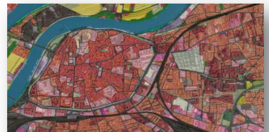
Extrait sur Avignon du MOS-2010

Depuis 2013, ce projet s'inscrit également au sein d'un dispositif de soutien régional en vue de la modernisation des territoires porté par la Région PACA, notamment au travers d'un appui financier visant à encourager l'élaboration de cartographies des modes d'occupation du sol (MOS) cohérentes à l'échelle régionale.